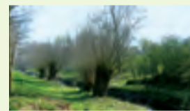
04 Kopfweidenlandschaft an der Niers