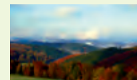
09 Blick auf das Ebbegebirge