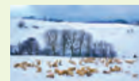
12 Fotograf: Ulrich Töpel Wixberg, Iserlohn