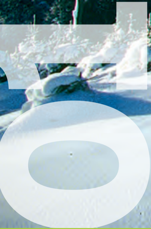
Wittgensteiner Land

Fr Sa So Mo Di Mi Do Fr Sa So Mo Di Mi Do Fr Sa So Mo Di Mi Do Fr Sa So Mo Di Mi Do Fr Sa So 1 2 3 4 5 6 7 8 9 10 11 12 13 14 15 16 17 18 19 20 21 22 23 24 25 26 27 28 29 30 31