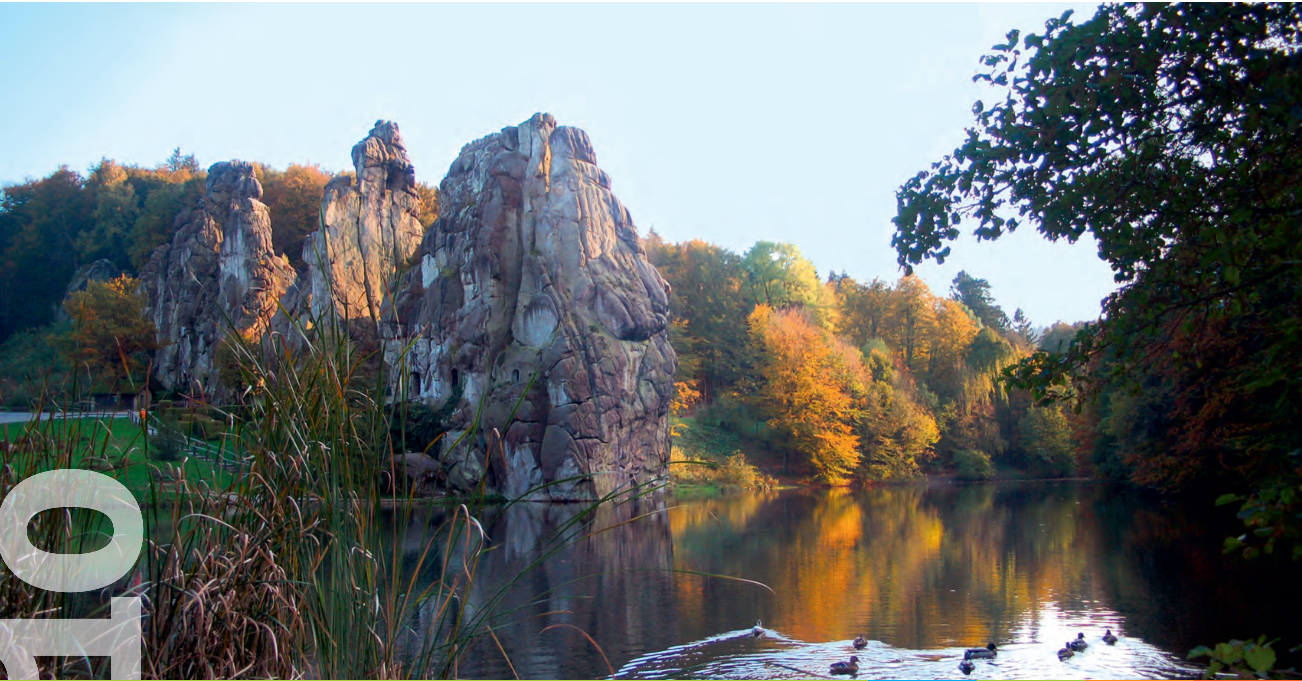
Externsteine, Teutoburger Wald

Fr Sa So Mo Di Mi Do Fr Sa So Mo Di Mi Do Fr Sa So Mo Di Mi Do Fr Sa So Mo Di Mi Do Fr Sa So 1 2 3 4 5 6 7 8 9 10 11 12 13 14 15 16 17 18 19 20 21 22 23 24 25 26 27 28 29 30 31