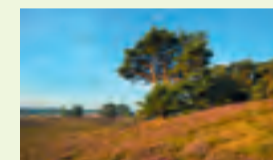
08 Westrupe Heide bei Haltern