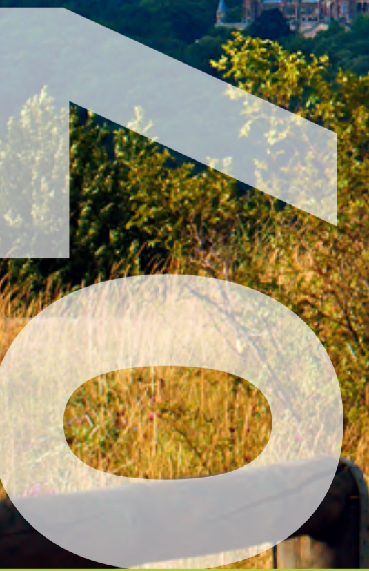
Fotografin: Ellen R. Dornhaus Drachenfels

Do Fr Sa So Mo Di Mi Do Fr Sa So Mo Di Mi Do Fr Sa 1 2 3 4 5 6 7 8 9 10 11 12 13 14 15 16 17 18 19 20 21 22 23 24 25 26 27 28 29 30 31