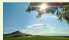
06 Warburger Land