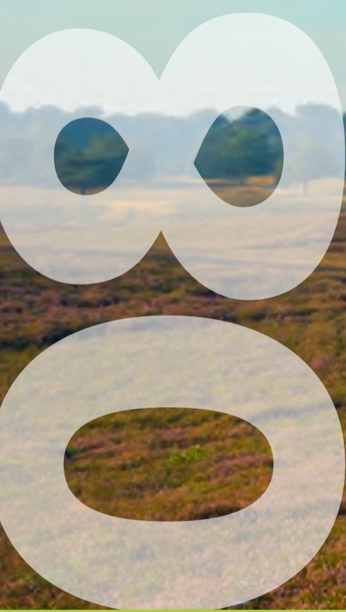
Westrupe Heide bei Haltern