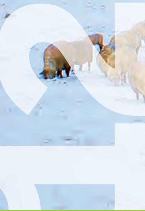
Fotograf: Ulrich Töpel Wixberg, Iserlohn

Mi Do Fr Sa So Mo Di Mi Do Fr Sa So Mo Di Mi Do Fr Sa So Mo Di Mi Do Fr Sa So Mo Di Mi Do Fr 1 2 3 4 5 6 7 8 9 10 11 12 13 14 15 16 17 18 19 20 21 22 23 24 25 26 27 28 29 30 31