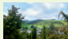
05 Blankenheim-Alendorf