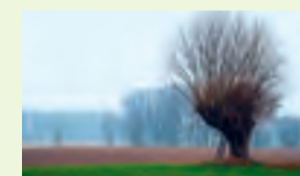
11 Bislicher Insel bei Xanten