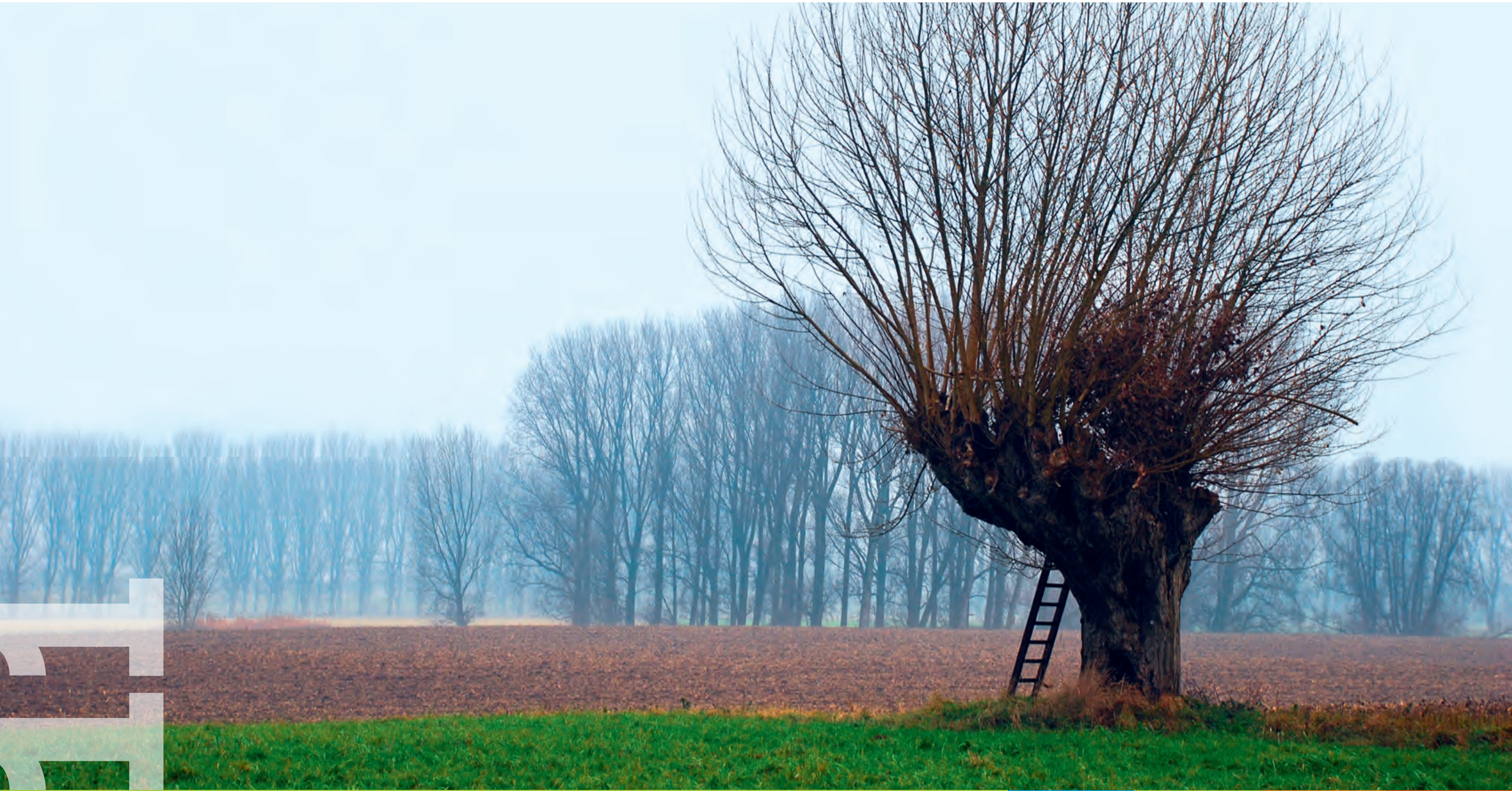
Bislicher Insel bei Xanten