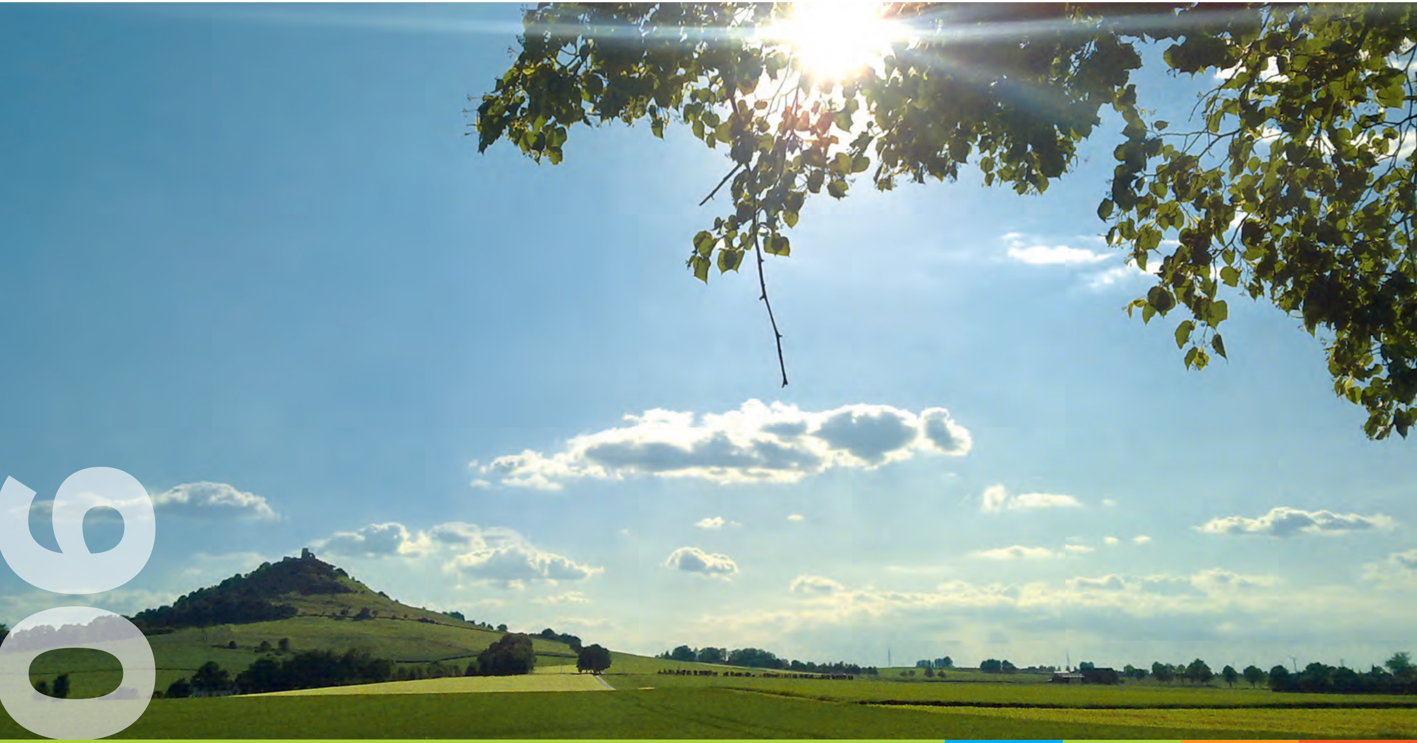
Fotograf: Benedikt Krinn Warburger Land

Di Mi Do Fr Sa So Mo Di Mi Do Fr Sa So Mo Di Mi Do Fr Sa So Mo Di Mi Do Fr Sa So Mo Di Mi 1 2 3 4 5 6 7 8 9 10 11 12 13 14 15 16 17 18 19 20 21 22 23 24 25 26 27 28 29 30