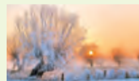
02 Winterlicher Niederrhein