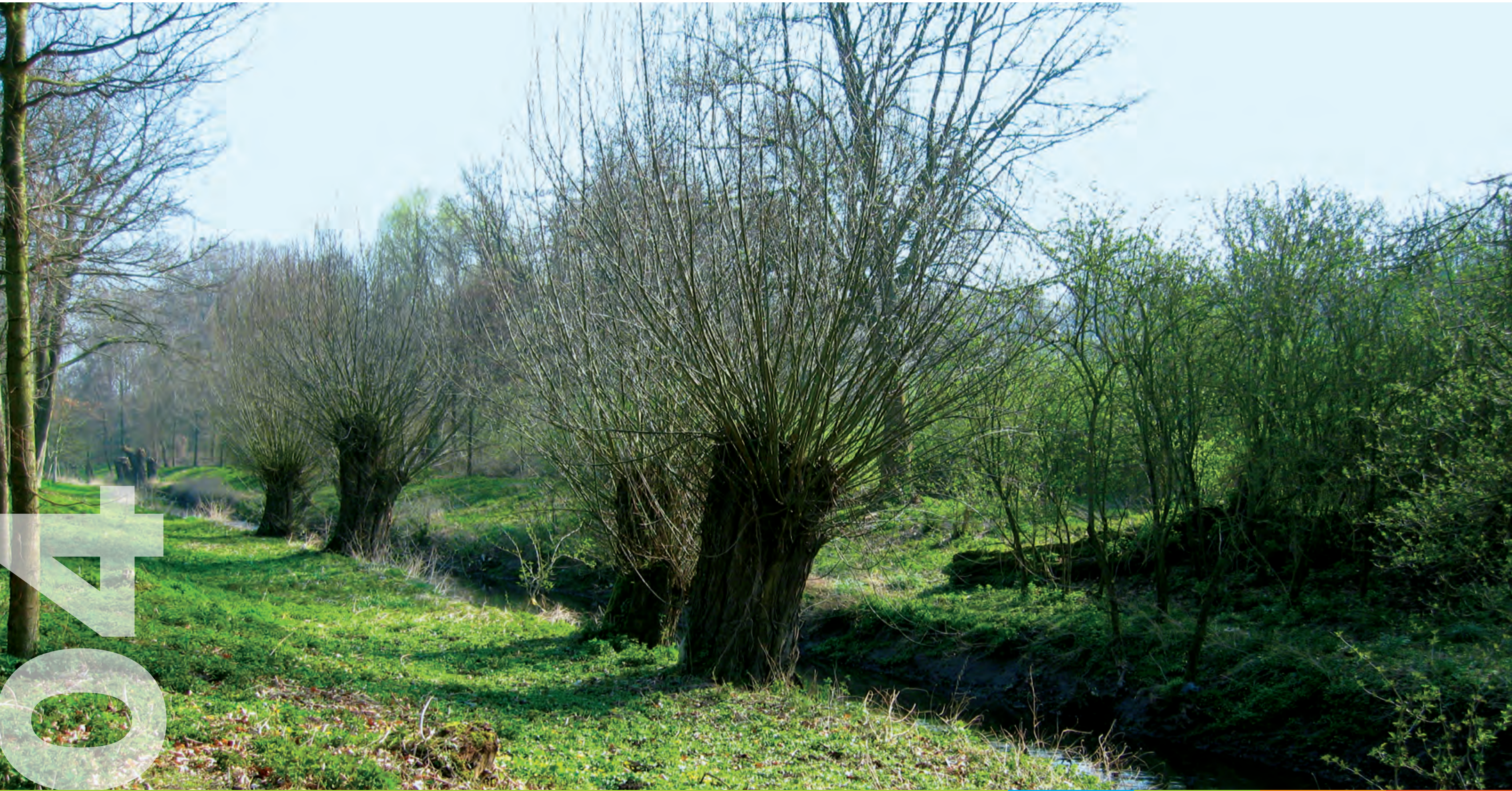
Kopfweidenlandschaft an der Niers

Do Fr Sa So Mo Di Mi Do Fr Sa So Mo Di Mi Do Fr Sa So Mo Di Mi Do Fr Sa So Mo Di Mi Do Fr 1 2 3 4 5 6 7 8 9 10 11 12 13 14 15 16 17 18 19 20 21 22 23 24 25 26 27 28 29 30