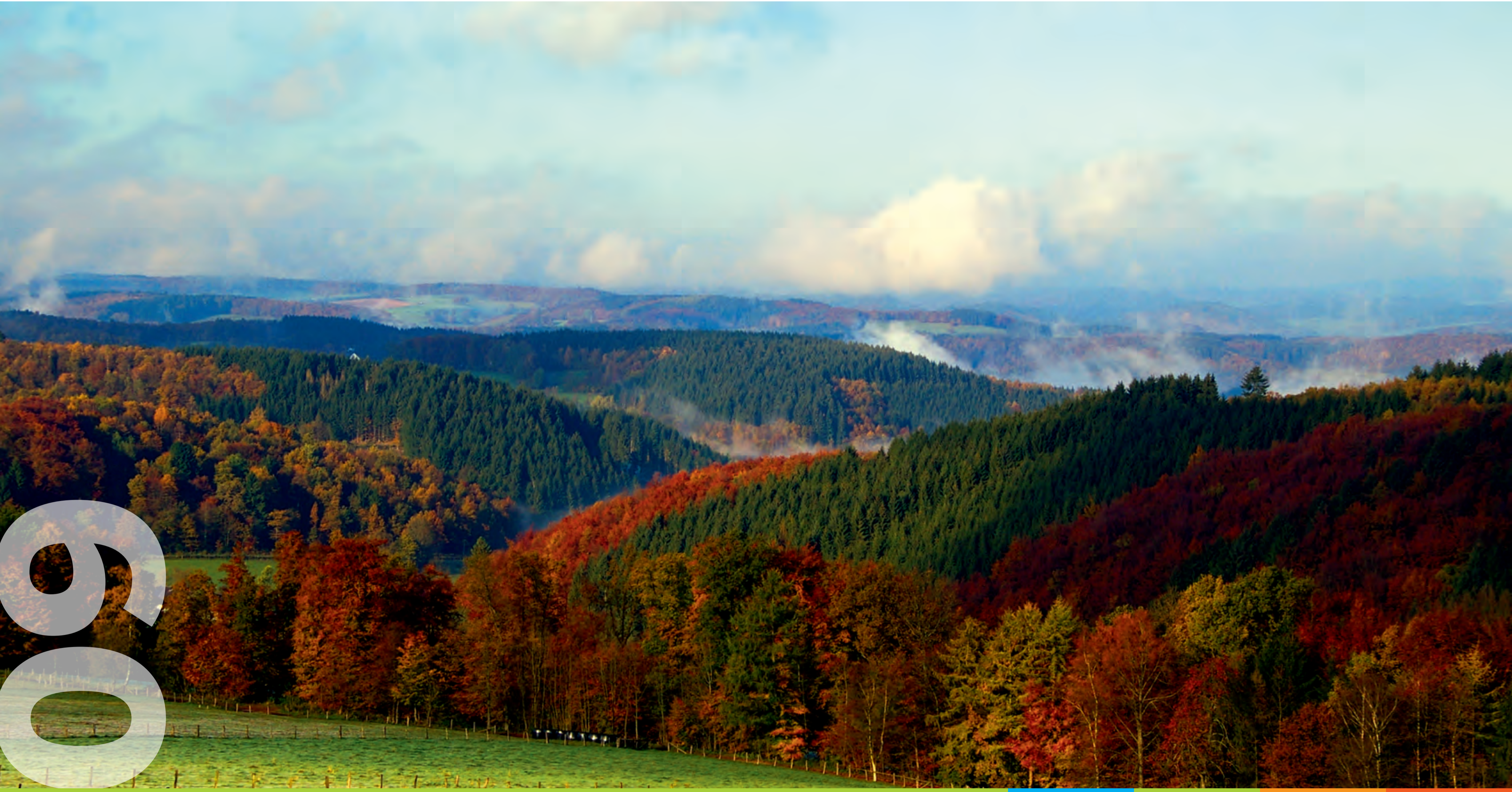
Blick auf das Ebbegebirge

Mi Do Fr Sa So Mo Di Mi Do Fr Sa So Mo Di Mi Do Fr Sa So Mo Di Mi Do Fr Sa So Mo Di Mi Do 1 2 3 4 5 6 7 8 9 10 11 12 13 14 15 16 17 18 19 20 21 22 23 24 25 26 27 28 29 30