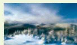
01 Wittgensteiner Land