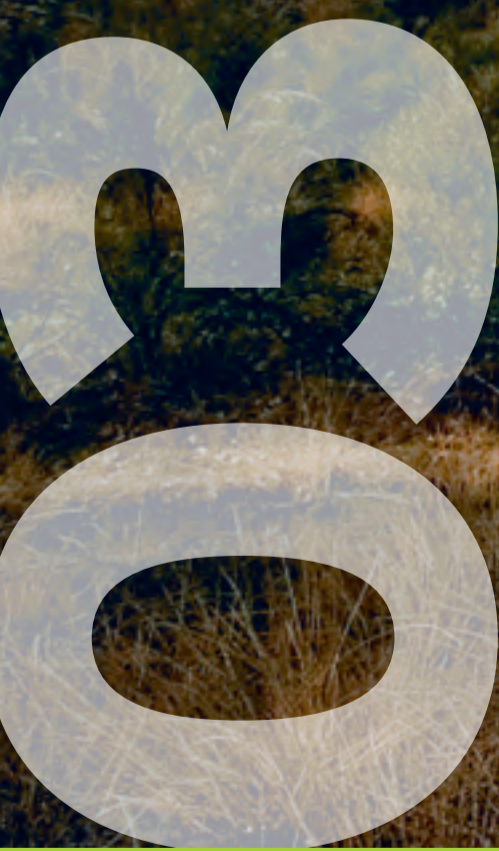
Elmpter Bruch – Kreis Viersen

Mo Di Mi Do Fr Sa So Mo Di Mi Do Fr Sa So Mo Di Mi Do Fr Sa So Mo Di Mi Do Fr Sa So Mo Di Mi 1 2 3 4 5 6 7 8 9 10 11 12 13 14 15 16 17 18 19 20 21 22 23 24 25 26 27 28 29 30 31