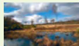
03 Elmpter Bruch – Kreis Viersen